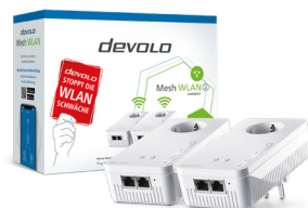
devolo Mesh WLAN 2 Starter Kit 08755 (DE, AT)