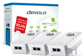
devolo Mesh WLAN 2 Multiroom Kit 08760 (DE, AT)