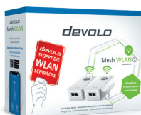
devolo Mesh WLAN 2 Starter Kit: Art.-Nr.: 08755 (DE, AT)