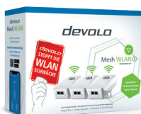
devolo Mesh WLAN 2 Multiroom Kit: Art.-Nr.: 08760 (DE, AT)